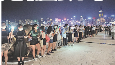
8月23日晚港人仿效30年前“波罗的海之路”抗争运动发起“香港之路筑人链”活动，21万人在港铁荃湾线、观塘线及港岛线30多个车站外组成共40多公里长的人链。