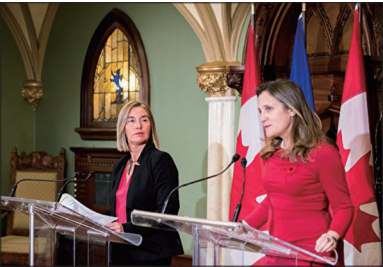
欧盟外交和安全政策高级代表费德丽卡·莫盖里尼（左）和加拿大外长方慧兰（右）发表联合声明，支持维护香港的自由和自治。

香港的局势牵动着四面八方，关乎着七百万港人的生死存亡，国际社会在密切关注着香港。香港的命运掌握在七百万港人的手中，也体现在国际社会的强大声援与支持中。从另一方面讲，香港的局势也为人类解体中共、彻底清除“共产邪灵”提供了一个难得的机缘，愿港人与国际社会抓住这天赐良机，一鼓作气，彻底清除掉危害人类的恶魔邪灵，恢复香港的永久和平与安宁！