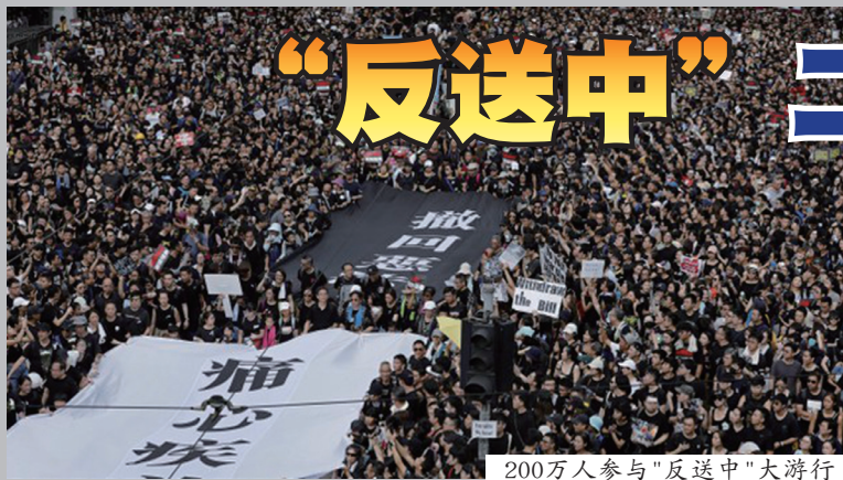
200万人参与“反送中”大游行