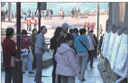
悉尼歌剧院前中国游客被真相展板吸引

澳大利亚悉尼歌剧院是世界闻名的旅游景点，一辆辆满载着大陆游客的大巴停在剧院附近的麦觉理街，在通向歌剧院的必经之路上有一堵巨大的岩石墙，墙上有近十米长的横幅链，横幅上的真相内容深深吸引着他们。