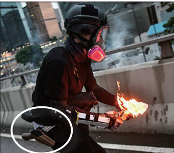
港警腰挂手枪假扮示威者朝香港政府总部扔汽油弹

针对香港“反送中”活动，中共媒体最初一律噤声，对国内严密封锁消息，后来又集中造谣，展开舆论攻势，配合官方的“暴乱”、“港独”、“恐怖主义苗头”等定性抹黑抗议民众。中共公然制造假新闻，或移花接木，或凭空捏造，或扭曲事实，充分自曝其丑。