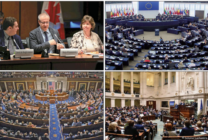
左上:加拿大自由党国会议员鲍瑞斯·瑞兹纽斯科基在国会听证会上用“当今时代最黑暗的罪恶”来形容中共强摘人体器官。右上:欧洲议会主席宣布制止强摘器官的48号书面声明。左下:美国众议院通过343号决议案要求中共停止针对法轮功学员等良心犯的“强摘器官”行为。右下:比利时联邦议会卫生委员会通过提案禁止器官旅游。

其他如比利时、意大利、爱尔兰、捷克、澳大利亚等多国政府部门、机构相继通过决议案制止中共强摘器官的罪行。包括以色列、西班牙、挪威、台湾等颁布相关立法阻止其公民从中国非法获得器官，已有显著成效。