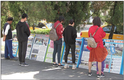
台北故宫的真相展板

近几年来很多中国人对真相都有些了解，越来越多的人听了三言两语的真相后就表示要“三退”。