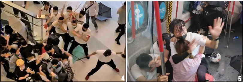
1.警察举起霰弹枪对准示威者；2.一名女子被布袋弹击中右眼；3.水炮车喷射蓝色水驱散示威者；4.7月21日数百名穿白衣的黑社会人士在元朗西铁站内追打无辜市民；5.8月31日港警在太子站无差别暴打无辜市民。