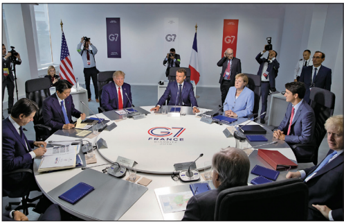
七国首脑联合肯定《中英联合声明》

8月26日七国集团峰会（G7）在法国落幕，七国领导人（美、加、英、德、法、日和义大利）支持在1984年《中英联合声明》中规定的香港自治权，同时呼吁各方保持冷静。