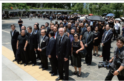
不同业别人士包括公务员、教育界、金融界、法律界、医护界、会计界、大专学界人士各行业纷纷分别走上街头抗争。图为法律界3000人游行。