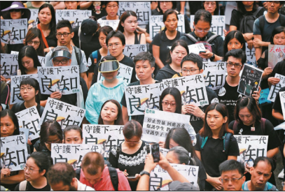
香港教师反送中游行高喊守护下一代