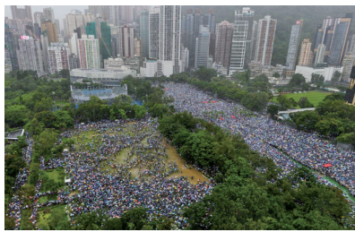
8月18日170万港人冒雨在中环遮打花园“流水式”集会

双真普选。由于港府没有撤回《逃犯条例》也没有回应民众五项诉求，完全听命于中共，祭出警棍、催泪弹、橡皮子弹、水炮，并抓捕800多示威者，沦为压制民声的前沿工具。加上随着警方不断升级武力驱散“反送中”示威者，港人的示威抗争方式仍持续着且越来越多样化。