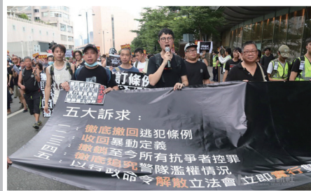
市民上街要求撤回修例等五大诉求