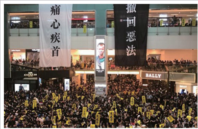
8月5日香港民间反送中发起罢市、罢工、罢课活动及七区集会，要求港府回应市民五大诉求。图为沙田新城市广场的集会。