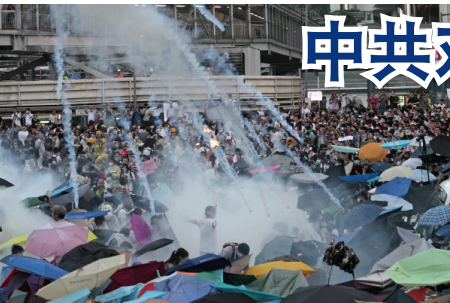
警方发射催泪弹暴力驱赶市民

中共有步骤地破坏“一国两制”，侵蚀香港的司法独立、新闻自由和言论自由，而且否定《中英联合声明》的约束力，公然撕毁承诺。在针对香港民众的合理诉求和抗争，中共对内严密封锁消息，制造假新闻，操控舆论，并且不断升级其对抗议活动的定性，同时将警力压制升级，再以武力胁迫，大搞秋后算帐，制造白色恐怖。