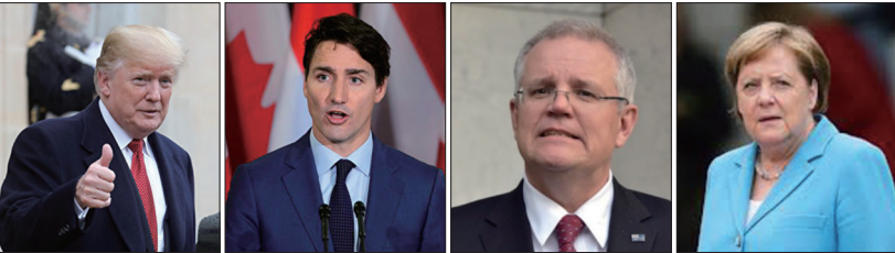
多国领袖政要发声关注香港情况，左起：美国总统川普、加拿大总理特鲁多、澳大利亚总理莫里森、德国总理默克尔。

香港紧张局势问题。澳大利亚总理莫里森不认同中共港澳办形容香港出现恐怖主义苗头，他期望香港特首林郑月娥细心以和平方式解决现时的严峻局面。8月17日欧盟外交和安全政策高级代表费德丽卡·莫盖里尼和加拿大外长方慧兰发表联合声明，支持维护香港的自由和自治。加拿大总理特鲁多提到香港局势，再次呼吁各方保持克制和尊重人权，他不想进一步升级加拿大和中国之间的贸易与外交争端，但加政府要捍卫自己的利益，也无意向中共退让。8月9日英国外交大臣多明尼克·拉布致电林郑月娥，表示英方支持香港的高度自治，强调和平抗议的权利。