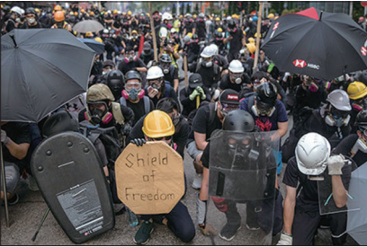
面对警方清场示威者毫不畏惧

经历两月有馀的血雨腥风，中共是个什么东西，给港人留下了刻骨铭心的记忆，因为中共的狰狞面目在他们面前已经暴露的淋漓尽致。从此以后港人不会再相信“一国两制”、“五十年不变”等谎言，为了香港的未来港人会抗争到底。