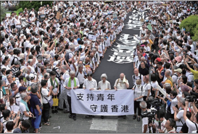
银发族声援年轻人抗争守护香港自由