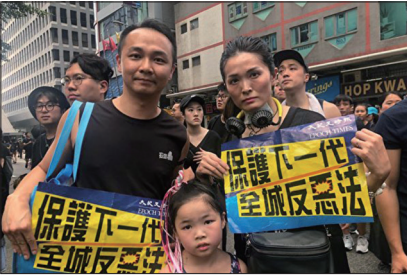
许多香港父母为保护下一代站出来