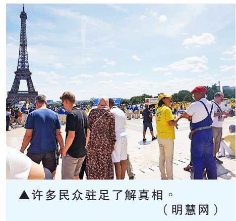
▲许多民众驻足了解真相。

我上高中以前还很相信共产党，第一次对共产党感到震惊的是知道了六四事件，但我也没有什么愤怒只是感到好奇。真正让我觉得共产党虚伪的是掩盖一些历史真相，抹黑国民党抗日功绩，自称中流砥柱，还强行把国和党绑在一起。还有就是控制言论自由，以前还可以在網上评论国家领导人，现在谈这些绝对会被封号，敏感词越来越多，21世纪也要搞避讳，现在连微信等社交软件都在政府监控下了。以及习修宪，搞个人崇拜，这让我彻底对中共感到失望，让我看到中共体制内真的有很大问题，甚至觉得中国的天空都是黑暗的。◇