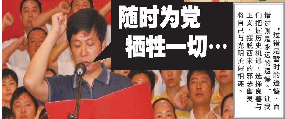
▲入中共党团队要举拳过肩发誓，说的是要随时为党牺牲性命，而且永远不背叛中共。这个誓言一出，就是一件极其可怕的事情。