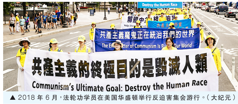
▲ 2018年6月，法轮功学员在美国华盛顿举行反迫害集会游行。

我对目前国际上已普遍认定的这个叫China的自称人民共和国，实则皇朝的荒诞集合体的未来，更加坚信只有不破不立；否则地球上这片叫China的区域，绝对不会有任意意义上真正的发