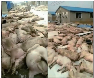
福建养猪场上万死猪叠尸

2018年自8月以来非洲猪瘟在中国大陆迅速蔓延： 中共官方却一再宣称“疫情处于点状散发，没有流行蔓延”，更于2019年3月19日宣布21个省份解除疫区封锁。中共掩盖疫情，直接导致非洲猪瘟病毒污染了肉制品加工业，或给人类健康带来影响。联合国发出警告称大陆的非洲猪瘟疫情只是冰山一角，并预料将扩散至亚洲其它国家。