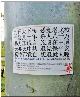
湖北荆州古城旅游区真相标语

自从2004年11月大纪元时报发表系列社论《九评共产党》，全面深刻地揭示中共的邪恶本质，打开了禁锢中国人民几十年的精神枷锁，从而引发席卷全球的中国民众三退大潮。这是