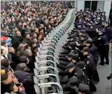
四川自贡市荣县开采页岩气导致发生多次“人工地震”至少4人死亡，多人受伤，上万民众聚集县政府前抗议遭遇警方镇压。

中国知名网路作家荆楚表示，中国社会的群体事件频发，其实突显了社会越来越不公平、越来越危险。因为中共独裁体制不改革，积累的问题就越来越多。老百姓出于不满、出于对自己权利的诉求，抗争是越来越多，这是必然的结果。社会矛盾积累到现在已经是全面爆发，中共已经没有办法挽救。