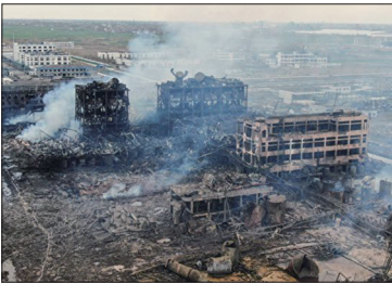
江苏盐城市响水乡陈家港的江苏天嘉宜化工有限公司发生爆炸。图为灾后现场航拍画面。

3月21日江苏盐城市响水县陈家港的江苏天嘉宜化工有限公司发生大爆炸。据官方数据，截至3月25日下午16时，事故造成78人死亡，六百多人受伤，其中危重19人，重伤98人。