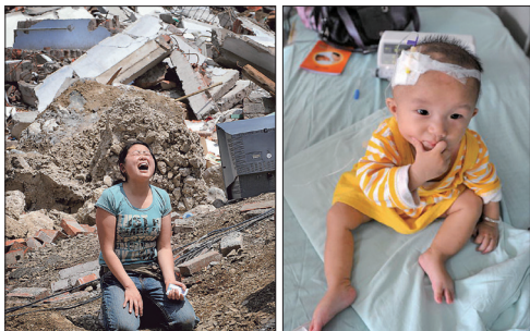
左图:汶川地震中大量学童死于豆腐渣工程；右图：成都毒奶受害婴孩。

2008年为奥运稳定隐瞒川震预报和毒奶事件： 2008年5月四川省汶川县地震前多位地震专家曾多次上书中央预报大地震，中共隐瞒预警造成重大死伤。8月爆发三鹿毒奶粉事件，中共当局和奶制品公司在奥运前就知道毒奶粉的丑闻，却隐瞒事实剥夺消费者知情权，估计中国有六百万婴幼儿受害。