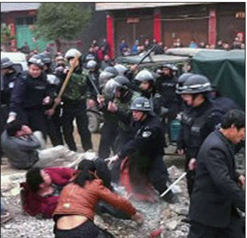
广西柳州市数百强拆人员深夜入村强拆民房，与村民发生激烈冲突，大批武警入村抓捕抗议者。

近来中国民众对中共不满情绪已到顶点，全国各地大规模群体事件遽增，民众抗争声音越来越盛，反应出中国政治体制严重滞后，导致地方政府黑社会化、官民对立矛盾丛生的严峻现实。