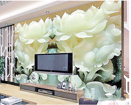
中共前军委副主席徐才厚因贪腐被抄家，被查抄的现金居然有1吨多重，地下室最少有200公斤和田玉，翡翠、历代古玩器具和字画，家中四处精雕玉琢的翡翠墙奢华让人惊呆。

以腐败治国危害人民利益。中共靠腐败治国，用金钱和利益笼络各级官员。中共官员几乎无官不贪，掠夺人民财产数额巨大惊人，国库正在被掏空。“改革开放”后，所谓的国营企业大多被掌握在中共权贵家族手中成私有财产。人大教授任剑涛在一次演讲中表示，中国权势集团垄断国有企业，200个家族控制200个行业。中国亿万富翁90％是中共干部子弟。大约2900人的太子党积聚了总共两万亿人民币的财富。这是造成贫富不均、两极分化的根本原因。