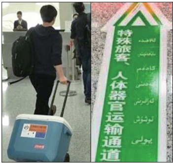
新疆某机场出现为人体器官运输专门开辟的快速通道。

据明慧网披露，中共总后勤部是活摘器官的核心机构，利用军队系统和国家资源将各地被非法拘捕的法轮功学员验血编号，输入电脑系统，并利用军车、军航、专用警备部队和各地军事设施和战备工程作为集中营，统一关押管理，成为国家级