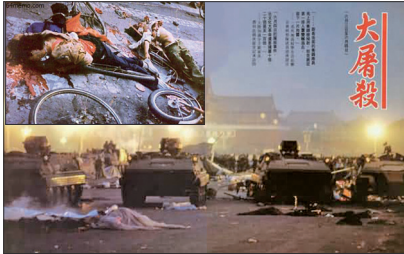
1989年6月4日中共装甲车冲进天安门广场“清场”，死伤无数。

1989. 6. 4 六四天安门事件： 八十年代共产党就推“反对资产阶级自由化”，提出“四项基本原则”，因为共产党要绝对领导权；共产党容不得民主思潮，1989年青年学生和平要求民主，遭到血腥“六四”镇压，造成上千人丧生。（中共却谎称天安门广场上没死一个人）