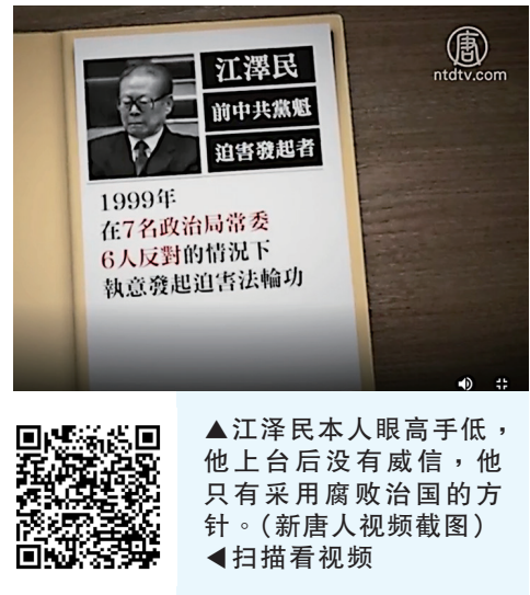
▲江泽民本人眼高手低，他上台后没有威信，他只有采用腐败治国的方针。 ▲扫描看视频

共产党的“老祖宗”马克思，早年曾经是基督徒，后来加入魔鬼撒旦教。撒旦教崇拜恶魔，与神为敌，是以破坏神的教诲、毁灭人性和人类为目的的一个邪教组织。1848年，马克思在共产党的第一份纲领文件《共产党宣言》的开篇就向世界宣布：共产主义是一个“幽灵”。这个幽灵显然就是撒旦的幽灵，是个邪灵。