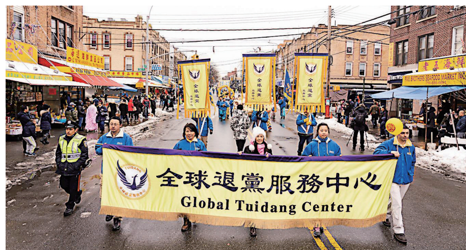
▲2019年3月2日中午，近千名法轮功学员在纽约的第三大华人社区——布碌仑八大道举行盛大游行。

武女士也说：“我觉得很激动，因为在国内看不到这些嘛，是被制止的，在这可以自由地发声，这很好。”