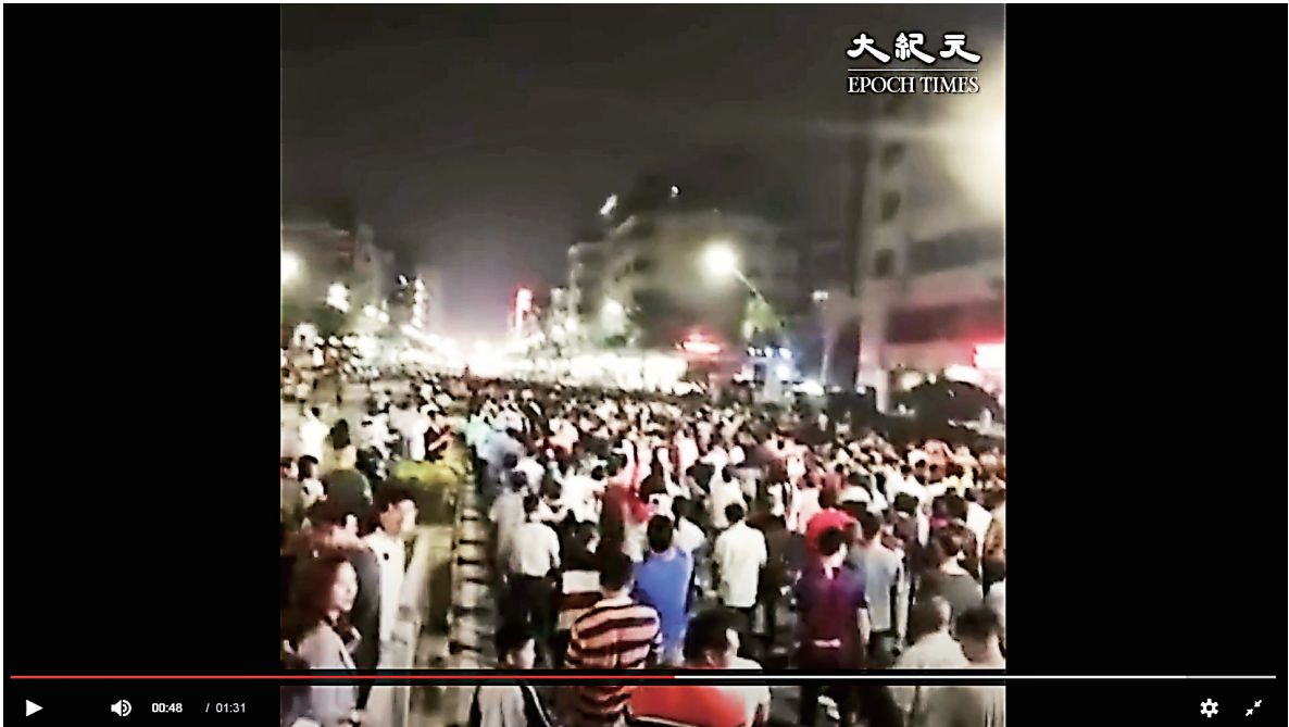
▲在中国国家主席习近平南下广东视察之际，10月23日开始，广东佛山突然爆发游行抗议。（视频截图）

据了解，镇上居民因不满项目咨询期过短，早前已有数百人上街游行，并收集逾6万人的签名向政府反映，但政府毫无所动，