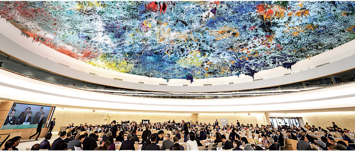
▲11月6日，联合国审议会议上，来自大约十几个国家的代表，其中大多数是西方国家，向中共代表团提出批评，谴责中共在新疆地区的拘留营网络。

有中国网民表示，正是美驻华使馆官微背后有“强大的祖国”，微博才不敢删帖、封号。◇