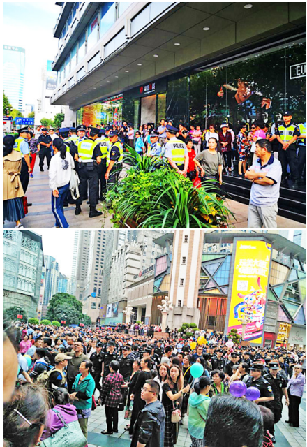
▲ 10月1日，大陆17个城市的P2P难民同步上街维权，各地警方如惊弓之鸟。上图为杭州现场，下图为重庆现场。

共产党的“老祖宗”马克思，早年曾经是基督徒，后来加入魔鬼撒旦教。撒旦教崇拜恶魔，与神为敌，是以破坏神的教诲、毁灭人性和人类为目的的一个邪教组织。1848年，马克思在共产党的第一份纲领文件《共产党宣言》的开篇就向世界宣布：共产主义是一个“幽灵”。这个幽灵显然就是撒旦的幽灵，是个邪灵。