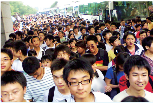
▲11月6日，重庆媒体称该市教育考试院表示，政审材料不合格者不能被录取。此事件引发网络热议。不久考试院人员前来澄清，然而，网民并不买帐。图为中国高考结束后，学生离开考场。

时事评论员横河对“新唐人”表示，中国的《高等教育法》是1999年1月1日施行的，里面关于学生的入学权利只有