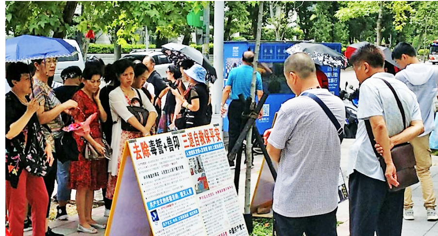
▲台北国父纪念馆前，大陆游客认真阅读法轮功真相展板。

一位资深导游主动对法轮功学员说，他都跟大陆团员说：“天下事，哪能不知道？法轮功（学员）发的这些报纸资料，可能就有你该知道的国际大事，而且都是免费的，有什么不能看的呢？”