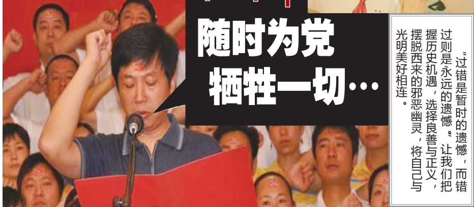
▲入中共党团队要举拳过肩发誓，说的是要随时为党牺牲性命，而且永远不背叛中共。这个誓言一出，就是一件极其可怕的事情。