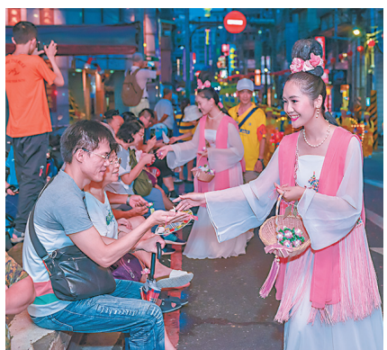
▲青年法轮功学员装扮的仙女向两旁观众发送纸莲花。

在热闹的游行队伍中，以法轮大法队伍最整齐盛大，法船造型的“法轮大法好”花车倍受瞩目，及由大约300位法轮功学员组成的天国乐团、仙女队与腰鼓队等，所到之处人们纷纷鼓掌、拍照。 仙女般的法轮功学员在发放莲花或真相资料时，几乎每个人都高兴的伸手接，共计发出1万多朵精美的纸折莲花，广受喜爱。◇