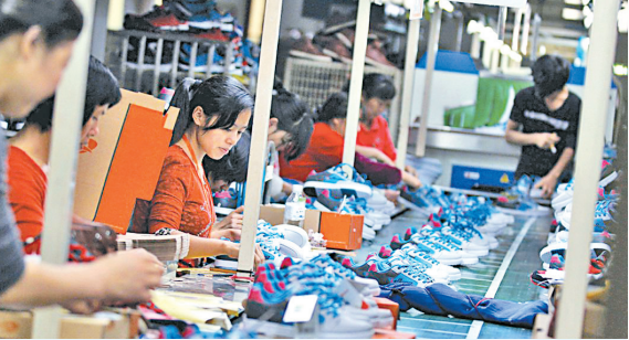
▲ 随着美中贸易战升级，在中国大陆的制造业纷纷撤离。图为中国鞋厂。

到纺织品等各种产品的中国工厂，正在积极向国外运输装配线，以便在产品向美国出口时因“中国制造”，从而被美国征税。