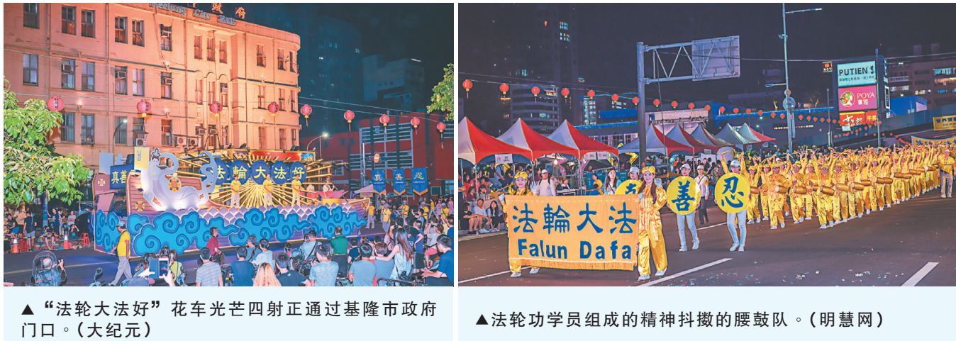
▲“法轮大法好”花车光芒四射正通过基隆市政府门口。 ▲法轮功学员组成的精神抖擞的腰鼓队。

被列为台湾12大地方节庆之一的“鸡笼中元祭”已有164年的历史了，今年8月24日晚间，在基隆市举行“放水灯大游行”是中元祭的重头戏，市区观众如潮，市长林右昌开场，接着由警察局重机车做前导车队，引领各姓氏宗亲会及演出团体踩街游行，宛如一场大型嘉年华会，行政院长赖清德出席并与今年轮值主普的赖姓宗亲会一同游行。