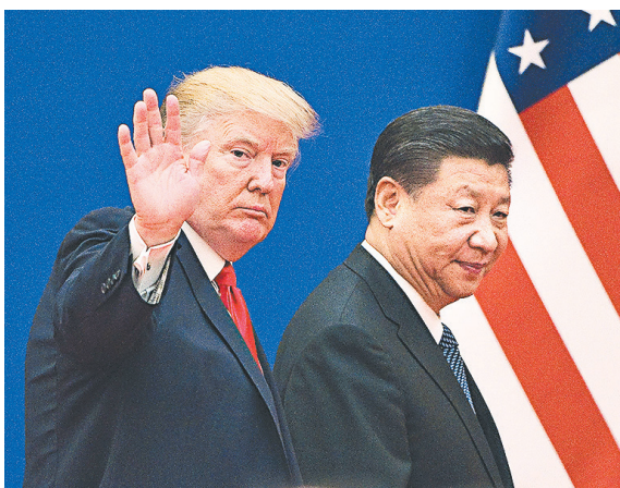
▲ 美国总统川普（左）与中国国家主席习近平（右）。图为 2017 年 11 月，川普访问中国。

析，中共引以为骄傲的高铁技术，就是透过日本、德国、加拿大的外资将技术转让给中国，拼装来的。这些先进国家不会对此视而不见。