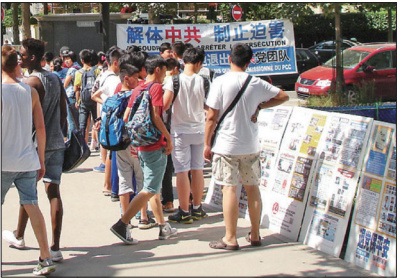
在巴黎的埃菲尔铁塔附近的法国退党服务中心帮助游客三退

这三亿“三退勇士”认清了中共的恶魔本性，从思想中抛弃中共站到正义的一边，为自己选择了光明美好的未来！