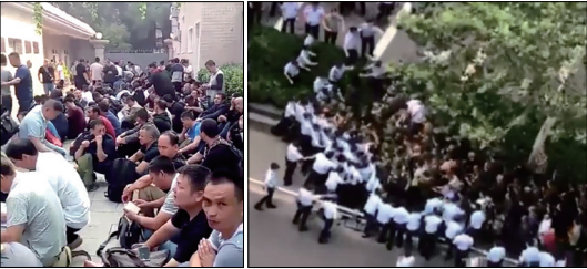
左图:9月10日北京中央军委信访大院前聚集数千名维权的退役老兵。 右图:四川近700名退伍老兵到省政府维权遭到警察镇压。

9月3日在中非合作会议期间，广东、山西、山东、湖南等多地老兵维权声浪四起。广东阳江老兵扎在市政府大门口，日夜乞讨高调维权。山西数百老兵聚集省政