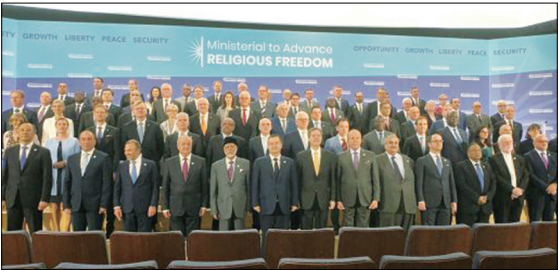
美国国务院举办首届全球部长级会议，包括来自世界各地的数十名部长级代表在内的80多个代表团与会。