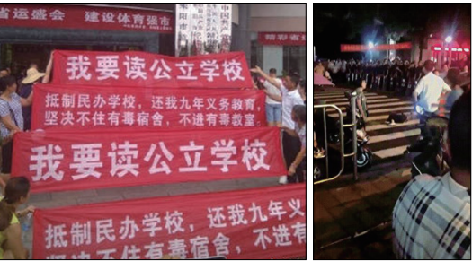
耒阳警方与民众发生冲突，有市民被暴力围殴。

事件致民怨沸腾，大批家长希望孩子返原校就读。据悉，部分民众被公安武警围住用警棍暴打，有部分民众在冲突中被打伤。目前当地政府仍然未给家长们一个明确的说法，仅称“妥善处理耒阳群众相关诉求”。