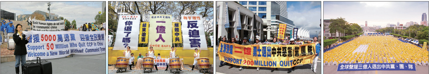
墨尔本民众贺五千万三退大潮