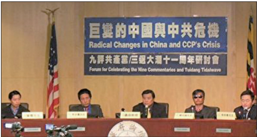
美国首都华盛顿DC举行大型研讨会纪念《九评》发表十一周年

《九评共产党》发表不仅震撼海内外华人,在国际社会上也引起强烈反响。十多年来全球五大洲有上百城市举办各种《九评》相关研讨座谈会、新闻发布会、图片展等活动至少有二千场、有上万名政要领袖、专家学者、媒体人、受害人等都站出来齐声谴责中共。