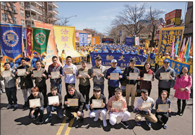
2018年4月22日全球退党中心主席颁发三退证书给18位公开三退的华人