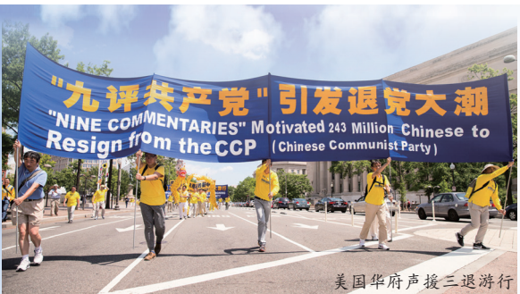
美国华府声援三退游行

2004年11月19日,《大纪元时报》发表系列社论《九评共产党》,从历史、政治、经济、文化、信仰等层面深刻剖析中共的欺骗、暴力、邪教和流氓本性,揭示共产党“假、恶、暴”及反人类、反宇宙的邪恶本质。