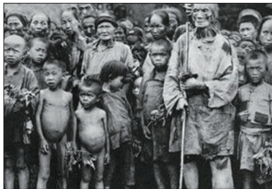
大跃进运动导致全国大饥荒