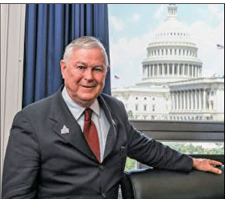
罗拉巴克议员接受专访