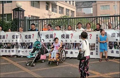
7月30日假疫苗受害儿童的家长在中国国家卫生健康委员会前维权

面对民众对今次假疫苗事件的怒火，7月25日中国各省宣传部门很快下令“停止炒作疫苗”，同日几乎大陆所有的大媒体都删除了与疫苗相关的报道，还严格管控和封杀网络信息，其中包括不加警告直接封闭帐号的措施，危害国民身体