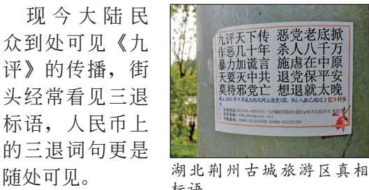
湖北荆州古城旅游区真相标语

2010年大纪元曾报道,云南一个民间组织当时成立不到一年已发展到18个县市,拥有会员11多万人。该组织人人均退出中国共产党及其相关组织;他们每一个星期大家看一次《九评》光碟、学一节《九评》,从来没有停止过。