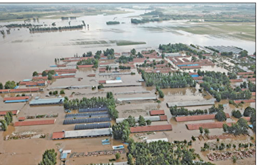
三大水库同时泄洪，导致寿光多个村庄被淹没。