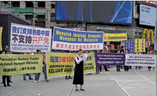
马来西亚退党中心举行声援逾三亿一千万三退勇士集会

援三亿一千三百万三退勇士，同时也呼吁民众了解共产党的邪恶本质，防止共产主义渗透到马来西亚，引起许多民众的关注，了解真相。