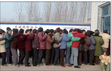
因卖血而染上爱滋病的村民排队领取抗爱滋病药物。