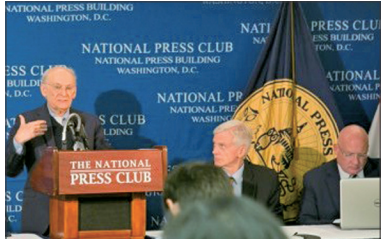
活摘器官最新调查报告新闻发布会

2016年6月22日大卫·乔高、大卫·麦塔斯和资深调查记者葛特曼在美国联合发布中共强摘人体器官最新调查报告，惊人数字显示中国器官移植手术数量每年约为6万－10万例；过去15年中，估计进行约150万例的器官移植手术，这些器官的主要来源是法轮功学员。