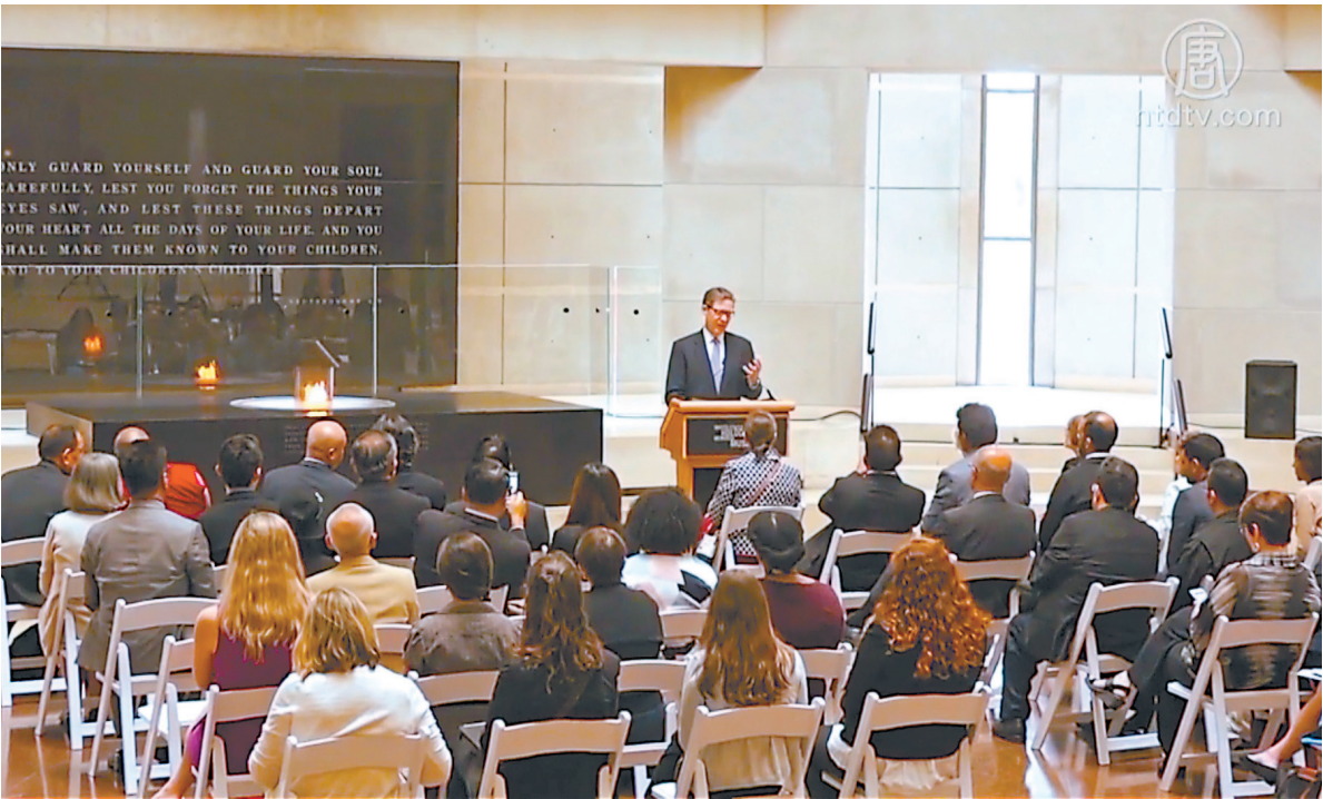
▲7月26日，美国国务院宗教自由部长会议发布一份针对中共的特别声明，对中国法轮功学员、维吾尔人、藏传佛教徒等团体的宗教自由状况表示关切，呼吁中共尊重人权。（大纪元）

中共在2017年花费约1.27万亿人民币作国内维稳，占政府总开支的6.1%，比军费开支还高。当中用于内部保安的开支，在新疆和北京地区翻了一倍。有研究中共维稳开支的学者指，这些开支一大部份用在了监控科技之上。◇