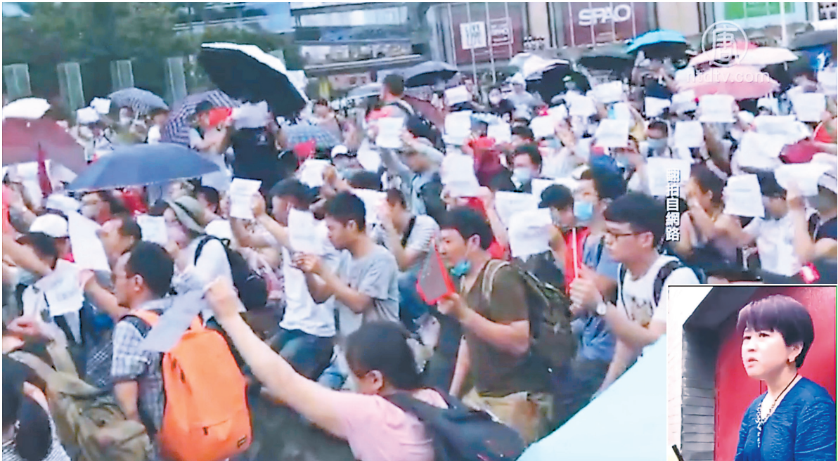
（上图）今年7月，大陆221间P2P融资平台倒闭，上万“金融难民”进京维权，引发中共恐慌，下令拦截访民。（右图）P2P金融受害人集体上京维权发起人，目前失踪。（视频截图）

关于“互联网金融真相”的帖子称：“国有银行的天量坏帐，已经超出了普通人想象，已经严重威胁到了金融稳定，成为悬在执政党头上的一颗定时炸弹！为了排雷，党想出了一条毒计，那就是以盘活民间资本的名义搞的互联网金融！”