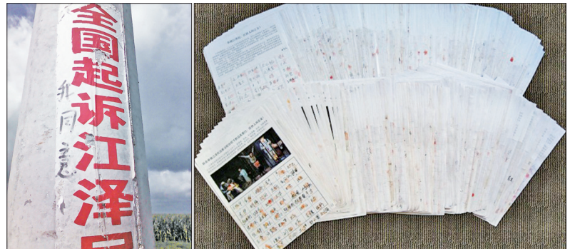
左：青岛街道旁标语“起诉江泽民”，有人回应“我同意”，表达了百姓的心声。

各地也出现大量诉江标语、不乾胶，越来越多中国民众签名声援诉江和控江。例如河北唐山市逾四万五千人举报江泽民，逾三万四千人支持起诉江泽民，合计超过八万人。湖南长沙至少10669人联名举报江泽民。辽宁省鞍山市、朝阳市举报江泽民的民众约十万人。自2015年末到2016年6月，辽宁凌源市逾万民众联名举报江泽民。至2017年3月济南地区逾21000名民众签名举报和支持起诉江泽民。