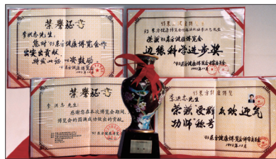
李洪志先生在东方健康博览会上获奖

调查12,553位法轮功学员，祛病健身总有效率达97.9%，每年节约2,100万元医药费。1998年下半年，以乔石为首的部份全国人大离退休老干部对法轮功进行详细调查和研究，最后得出“法轮功于国于民有百利而无一害”的结论。