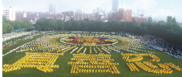
1998年武汉法轮功学员壮观排字

法轮大法（也称法轮功）是1992年5月由李洪志先生从长春传出的佛家上乘修炼大法，以宇宙最高特性“真善忍”为根本指导，按照宇宙演化原理修炼，同时包含五套缓慢优美的功法动作，是一套性命双修的修炼方法。