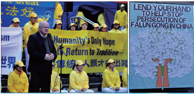
左:悉尼帕拉马塔市长威尔森在集会上发言声援法轮功 右:500个由民众签名的纸手,在展板上组成一棵巨大的支持树