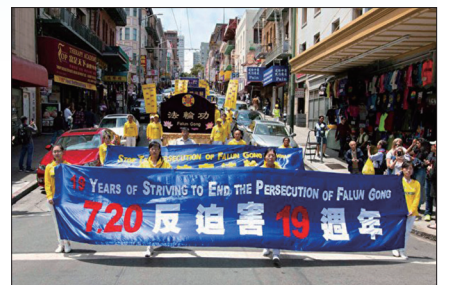
旧金山法轮功学员举行720游行活动