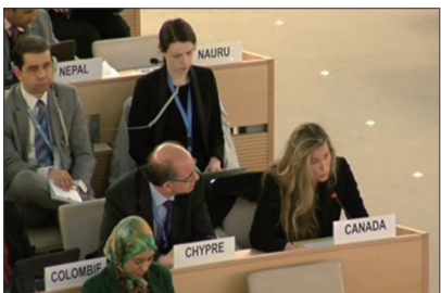
人权委员会加拿大代表罗里女士在联合国会议上关注中国法轮功学员受迫害情况及器官移植问题。

意大利参议院人权委员会2014年2月26日通过决议案要求制止中共活摘法轮功学员器官。意大利佛罗伦萨省议会2012年6月27日通