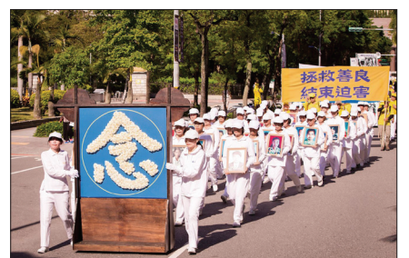
台北法轮功学员举行反迫害大游行