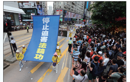
香港法轮功学员举行720反迫害集会游行

在美国国会山前的法轮功集会上,联邦众议员罗拉巴克说:“为了让我们的世界变得更好,历史上很多人都为此牺牲了自己的生命,而那些被抓捕的法轮功学员是这些人中最高尚的,是为了全人类的美好事物而坚守。他们是全人类最伟大的英雄!”