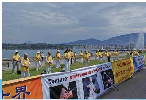
瑞士法轮功学员在日内瓦湖畔的联合国人权高级专员署前集体炼功