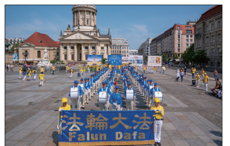
欧洲法轮功学员在柏林举行反迫害活动