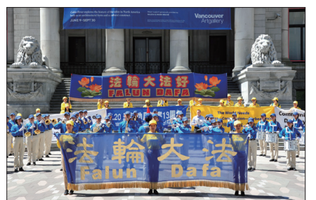
温哥华法轮功学员举行720反迫害集会