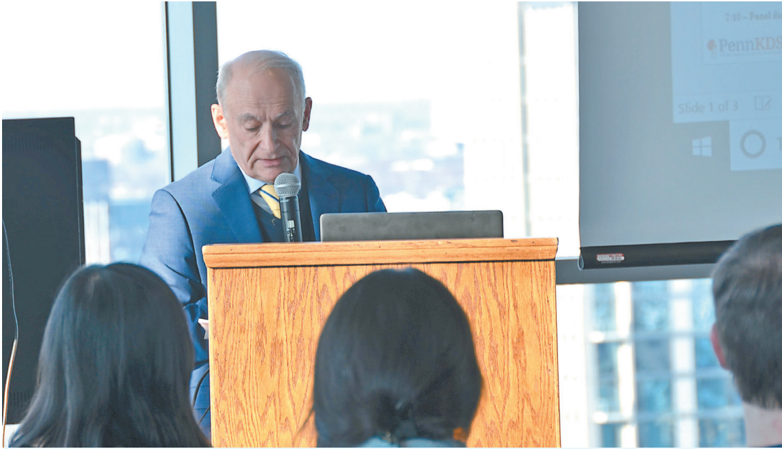
▲著名人权律师戴维·麦塔斯在常青藤宾夕法尼亚大学的“器官强摘与全球器官黑市研讨会”上演讲，揭中共活摘法轮功学员器官的暴行。