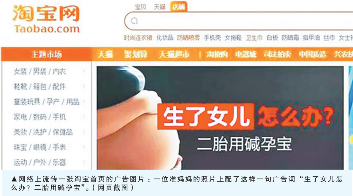
▲网络上流传一张淘宝首页的广告图片：一位准妈妈的照片上配了这样一句广告词“生了女儿怎么办？二胎用碱孕宝”。(网页截图)

地下水的污染令民众忧心忡忡。有网民表示：“地下水被污染成这样，老百姓还怎么活呀？”有人说：“地下水是这个民族的未来的保障。其实，中共把这个民族彻底毁了。”“还我河山，还我好山好水！”◇