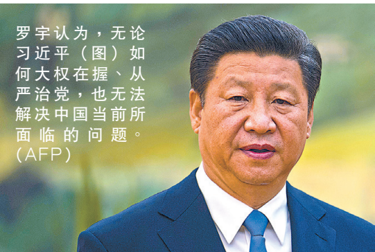
罗宇认为，无论习近平（图）如何大权在握、从严治党，也无法解决中国当前所面临的问题。

重的真正根源，正是因为不受民众监督的“一党专政”，若强化“一党专政”，也只是让腐败集团、利益集团转为另一批人。如果说“习近平新时代中国特色社会主义思想道路”，就是要把“一党专政”贯彻到底，那么最终都只有一个结论：此路不通。纵观历史，惟有民主与法治，才是治本良方。