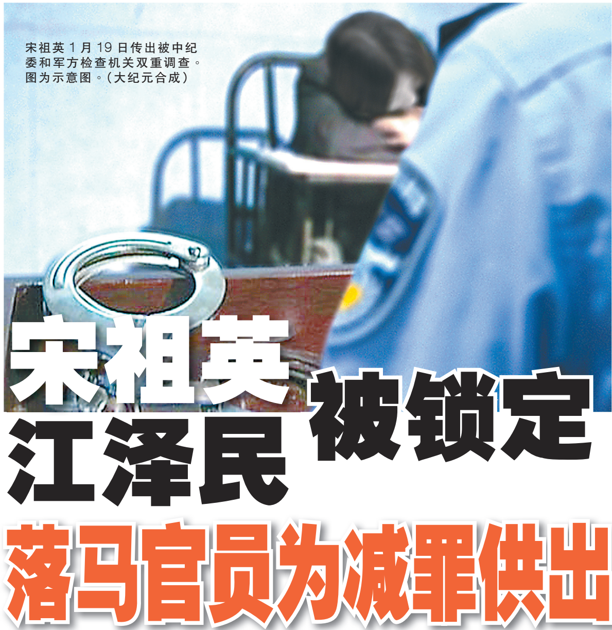
宋祖英 1 月 19 日传出被中纪委和军方检查机关双重调查。图为示意图。（大纪元合成）