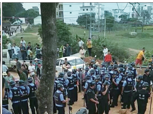
广西桂平市西山镇白兰村白额屯发生警民冲突，30多名村民被抓，10余人被打伤。

庄通往外界的唯一道路被警方封锁。据悉，目前整个村庄网络与通讯已被屏蔽，当地政府正极力封锁消息。