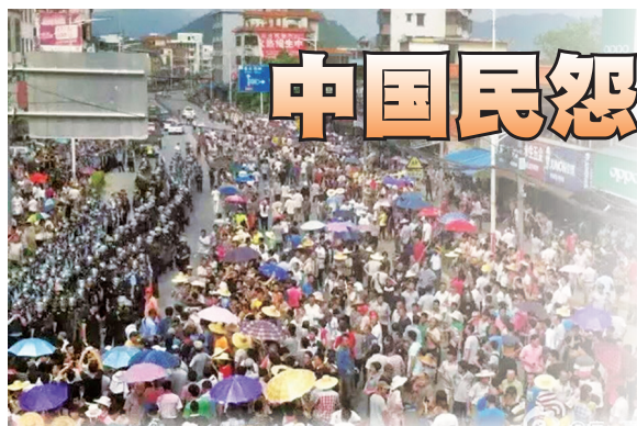
广东肇庆市禄步镇发生大规模示威游行

开始至今，白兰村的土地已经几乎全部被徵占，村民失去生活来源，“过低的赔偿让村民怎么生活，3年来村民到处去上访，结果都被地方政府打压，村民是有冤无处诉。”