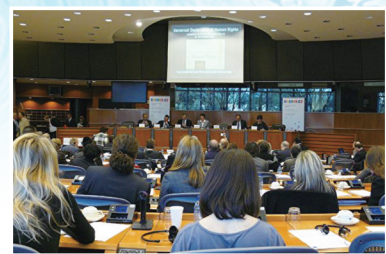
欧洲议会举行欧洲良知和共产极权罪行的听证会

2009年3月18日欧洲议会举行“欧洲良知和共产极权罪行”听证会。曾两次担任爱沙尼亚总理的马特·拉尔先生于听证会表示，共产主义在全世界都犯下了相同的罪行，所在之处皆是酷刑、虐杀人民。