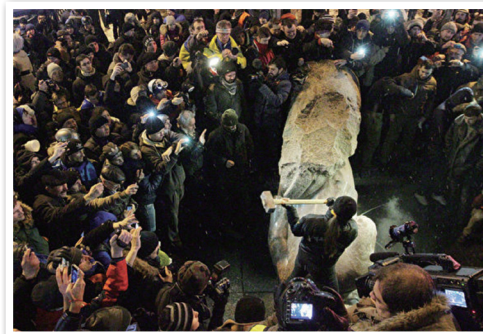
图为2013年12月8日乌克兰首都基辅市中心一座列宁塑像被推倒。乌克兰民众从此在全国掀起推倒列宁雕像的弃共行动。

的纯洁，必须认识并清除共产主义的毒害，这对于每一个国家、民族和个体都至关重要。在共产主义华丽外衣的背后，隐藏着魔鬼的诱惑。共产主义只会把人类拖入深渊。