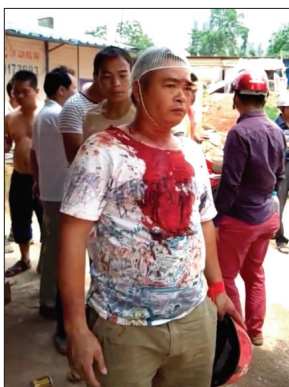
广西南宁市良庆镇那黄村 村民被打伤

警察用警棍、电棍、盾牌等打人并释放烟雾弹，30多名村民被抓，10余人被打伤。警方持续抓人，很多村民不敢回家，受伤村民不敢去医院。村