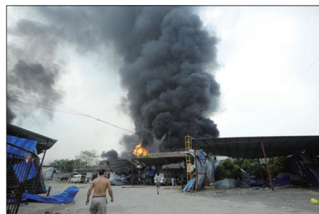
江苏南京栖霞区一度弃塑料化工厂爆炸

2010年7月28日江苏南京百江燃气大爆炸，在死伤严重的一家塑胶厂里，有个工人一上班领导就让他去江甯区办事。碰巧他的妻子也在发生爆炸之前几分钟，被经理派出去办事，就在她离开几分钟后，爆炸就发生了！