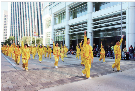
美国休士顿法轮功学员参加当地的感恩节游行，向观众展示法轮功功法动作。

11月23日美国休士顿法轮功学员参加当地的H-E-B感恩节游行，并被选中在当地主流电视台录像和直播的表演区演示法轮功的功法。