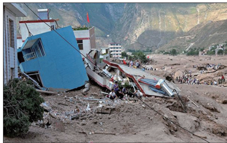
甘肃省舟曲县泥石流造成重大伤亡

丰迭乡丰迭村有一位30岁男子，经常看法轮功真相光碟，明白后“三退”。他住在江盘乡后坝村桥子旁，大灾难发生的那天晚上他在家上网，朋友打电话将他叫走；走后不久他住的地方就被淹没了，他庆幸自己明真相得救了。