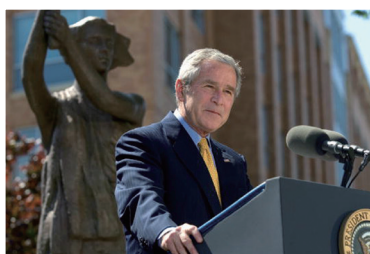
前美国总统布什在共产主义受害者纪念碑揭幕式上演说

建造共产主义受害者纪念碑。2007年6月美国前总统布希在华盛顿为共产主义受难者纪念碑揭幕仪式上演讲中，揭示出“共产主义就是恐怖主义”的道理。人类要自我救赎就必须彻底清算和杜绝共产主义。