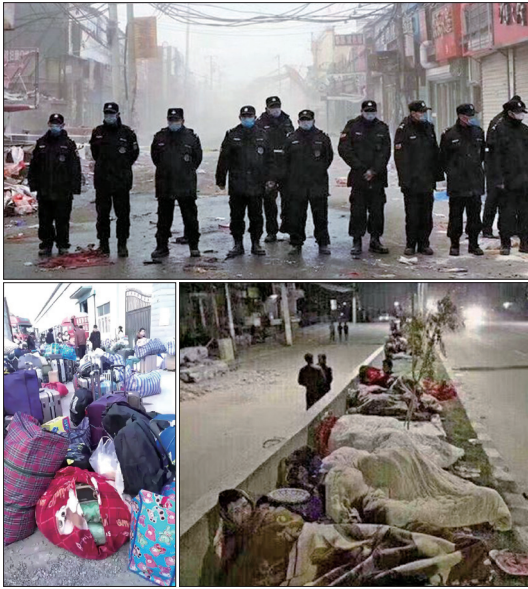
北京动用公安、城管等多部门人员强拆违章建筑，并驱赶外地租户，人们指出这形同纳粹。许多无家可归的人只好在街头露宿。

北京的“低端人口”正在因一场大火的缘故，遭到更大范围的清理。网上视频显示，当局在强拆出租房屋的同时，大批被视为低端的人口如潮水般被驱逐到街上。网民批评，当局的做法犹如当年党卫军对付犹太人。