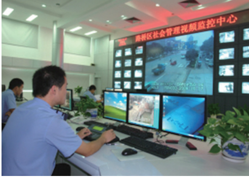
内地多个城市建立庞大的网路监控系统，对百姓进行全方位监控。

GFW和骇客一样用各种欺骗手段窃听、干扰或阻断用户正常通信，将中国人与互联网自由世界隔绝，令之活在红朝谎言之中。中共网路锁国、遮罩真相，完全是为了一己之私，却欺骗、坑害所有中国人。