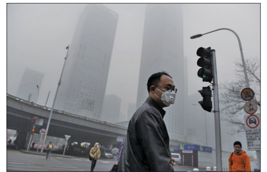
北京空污严重危害人体健康

近年来，雾霾对大陆大部分地区造成的污染，使人们的焦点往往集中于此，而忽略了臭氧对一些地区的巨大影响。虽然中国当局宣称，要治理空气污染，但其工作重点大多放在降低重点地区的PM2.5浓度上，并没有为降低臭氧浓度设定目标。