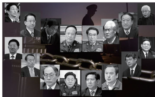
那些被拿下的贪官、老虎们多是所犯罪行极大，他们交代出了导致腐败的惊人内幕，使腐败源头浮出水面。

近平上任还不到5年的时间里，已处理了134.3万名乡科级及以下党员干部，64.8万名农村党员干部。