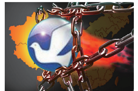
自由门和无界浏览是摧毁中共网路长城以及世界上其他专制国家的网路封锁的最佳利器。

中国人权律师郭国汀指出“中共长期以来一直极为严厉的党禁报禁，旨在推行愚民政策，以便维护其特权犯罪利益集团一己私利。”然而讯息真相就是生命的保障。言论、资讯自由流通可消除误解、揭穿谎言，独裁者们深知人民知道的真相越多就越危险，崩溃的就越快。因此中共严加控制新闻媒体、封锁网路消息、箝制言论自由，切断人们了解真相的途径以达到控制百姓和维持自己的地位。