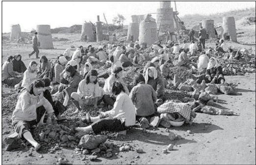
1958年大跃进：全民大炼钢铁场面

1958年中共开始推动“大跃进”，导致三年空前大饥荒。“全民炼钢”使大量庄稼抛洒在地里无人收割；各地虚报粮产量，农民上交的粮食不够虚报的数目，政府就逼农民把自己的口粮、种子全搭上。当时甘肃、山东、河南、安徽、湖北、湖南、四川、广西等地饿殍遍野，甚至出现人吃人的惨况。过去大饥荒发生时，官府总要设粥厂，开仓放粮，允许饥民逃荒，但中共显然认为逃荒会有损“党的威信”。于是派民兵把守乡村的交通路口，防止饥民外逃。甚至在饥民忍无可忍去粮管所抢粮时下令开枪镇压，并诬蔑被枪杀的饥民是反革命分子。