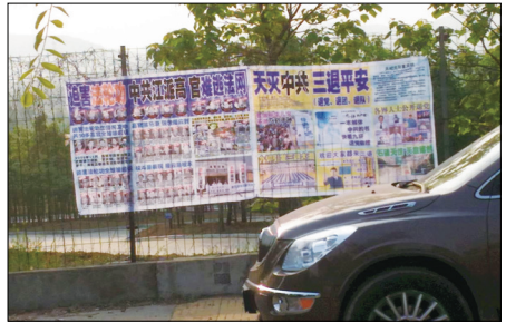
山东省沂水的真相展板