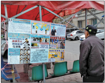
辽宁鞍山地区的真相展板