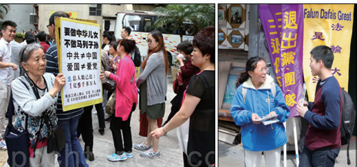
各地退党义工帮助民众办理三退

至2017年9月，大纪元退党网站显示三退人数达到二亿八千三百万。目前在全球三十多个国家和地区设立共达上百个区域性的退党服务中心或服务站，数以万计的志愿者在为民众三退提供服务。