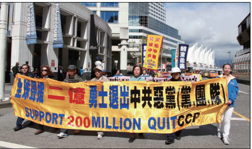
温哥华游行庆祝二亿人三退

退出中共，是从思想深处肃清共产邪恶，摆脱心灵枷锁，脱离共产魔教，找回做人的尊严，找回人的道德良知，是生命回归善良、迈向光明的关键决断。浩荡「三退」潮是上天赋予中国人的大智慧，是一场伟大的精神觉醒运动，是一场善与恶的重大抉择，是对生命的彻底拯救。这些三退勇士所展现的精神为中华民族开创光明未来新的里程碑。中国民心在觉醒，三退大潮势不可挡！