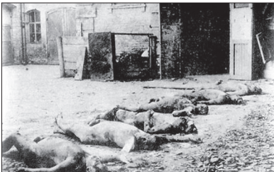
列宁授权秘密警察（契卡）可以随时枪毙公民。图为处决者被抛尸。

列宁的老师、俄国思想家普列汉诺夫看出列宁残忍狂暴的面目，他临终时口授一份《政治遗嘱》，其中提到，“列宁为了达到既定目标什么都干得出来，如果有必要，他甚至可以同魔鬼结盟。”“列宁为了把一半俄国人赶进幸福的社会主义未来中去，竟能够杀光另一半俄国人。”