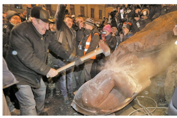
乌克兰民众推倒列宁像