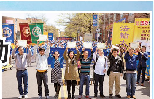
2017年4月纽约法拉盛举行纪念“四二五”法轮功和平上访18周年大集会。七名华人现场公开宣布三退。