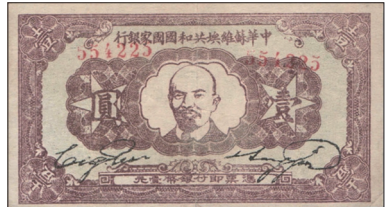
中华苏维埃共和国发行的列宁头像的货币

1931年9月18日日本占领东三后的两个月成立伪“中华苏维埃共和国”，率先分裂中国。直至该政权1937年9月结束，期间不但颁布共和国宪法，成立银行发行货币，设计有国旗，同时将其所属控制区域称为“苏区”，“苏”字缘于俄语汉译“苏维埃”。发行的独立货币将苏联领袖列宁头像印在货币上。这是中国历史上首次将外国人头像印货币上。