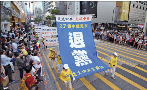
2017年5月7日香港法轮功学员举行反迫害、声援2.7亿中国民众退出中共党团队大游行。

前欧洲议会副主席爱德华-麦克米兰·史考特表示，“三退”提供了中国人解脱共产主义精神枷锁，是为自己创造美好未来的机会。曾两次担任爱沙尼亚总理的马特·拉尔先生表示，人们需要知道：不论共产党在哪里，他们都是邪恶的。人们需要退出，越快越好！全世界风起云涌的谴责、清算和退出共产主义的运动，显示去共化大潮势不可挡。