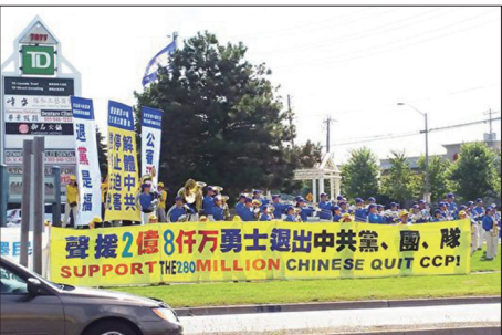
多伦多民众声援二亿八千万人三退

2017年8月12日上午，多伦多部份法轮功学员在北美及多伦多最大的华人市内商场-太古广场前的十字路口举办声援二亿八千万人退出中共。天国乐团的演奏和醒目的横幅吸引来往的乘客和路人，有鸣笛和竖起大拇指表示支持的；有华人做现场三退的。