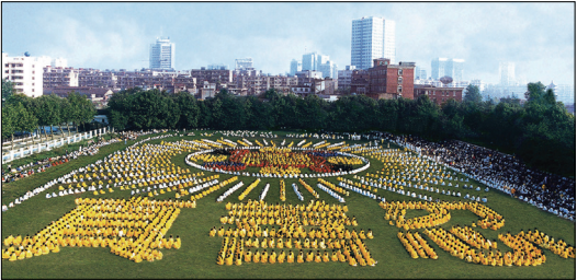
1998年武汉市5千多名法轮功学员排字

法轮功学员信仰“真、善、忍”，相信神佛、善恶有报，和中共的无神论、“假、恶、斗”等邪理相反。江泽民出于对法轮功及其创始人李洪志先生的妒忌和独裁权欲，利用共产党固有的邪恶和中共