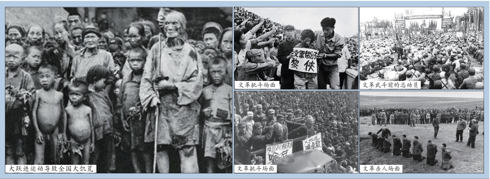
大跃进运动导致全国大饥荒

中共杀人多少不是目的，重要的是其杀人的一贯性。中共通过杀人来满足其大权在握、生杀予夺的变态快感；缓解内心的恐惧；压制以前杀人所造成的社会冤仇和不满。时至今日，中共由于血债累累已无善解的出路，而又依靠高压与专制维持到它生存的最后时刻。即使有时采用“杀人，平反”的模式来迷惑一下，但其嗜血的本质从来没有变过，未来更不可能改变。共产党的暴力传统是一脉相承。只要共产党存在，它的暴力本质就不会改变。