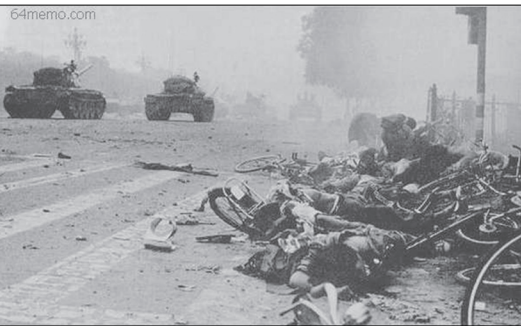
天安门附近布满学生的尸体和自行车残骸

1989年4月15日，前中共中央总书记胡耀邦病逝，许多北京大学生与市民到天安门广场举办悼念活动。后转向要求政府反贪腐、反官倒、争取民主及自由等诉求，与绝食行动。5月20日北京市实施戒严，并调中共军队三十万兵力前往。6月4日中共军队出动坦克武力镇压并实施清场，屠杀手无寸铁的学生与市民，造成上千人丧生。