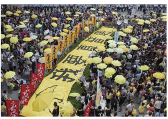
香港雨伞运动争取真普选