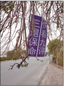
辽宁盖州市街头的真相树挂