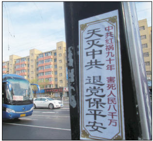
吉林市大街上的三退标语