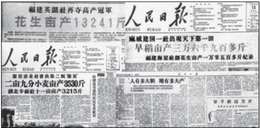
《人民日报》在大跃进期间的浮夸造假报道

1958年中共开始推动“大跃进”，导致三年空前大饥荒。“全民炼钢”使大量庄稼抛洒在地里无人收割；各地虚报粮产量，农民上交的粮食不够虚报的数目，政府就逼农民把自己的口粮、种子全搭上。当时甘肃、山东、河南、安徽、湖北、湖南、四川、广西等地饿殍遍野，甚至出现人吃人的惨况。过去大饥荒发生时，官府总要设粥厂，开仓放粮，允许饥民逃荒，但中共显然认为逃荒会有损“党的威信”。于是派民兵把守乡村的交通路口，防止饥民外逃。甚至在饥民忍无可忍去粮管所抢粮时下令开枪镇压，并诬蔑被枪杀的饥民是反革命分子。