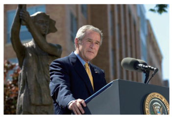
前美国总统布什在共产主义受害者纪念碑揭幕式上演说