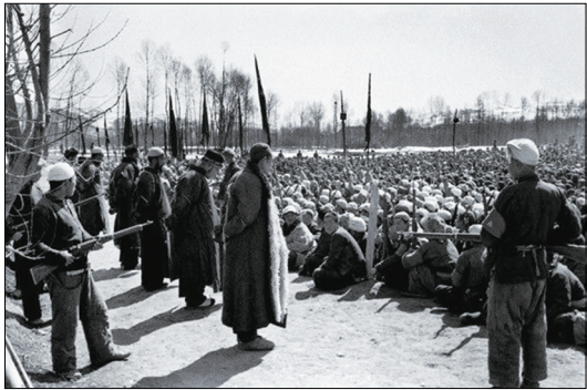
1951年青海省西宁市湟中县上五庄土改斗地主

乱，中共的所谓改革并不能解决目前的危机。因为中国各种社会问题的根源都是中共体制造成的，如果不能真正使得信仰得到保护，道德提升，让宗教信仰自由，中国的一切社会问题都不会得到解决。