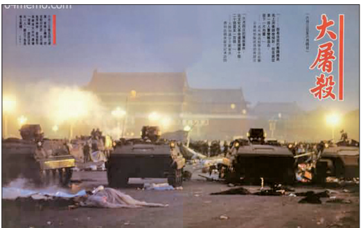
1989年6月3日晚至4日凌晨，中共装甲车冲进天安门广场“清场”，学生与市民死伤无数。