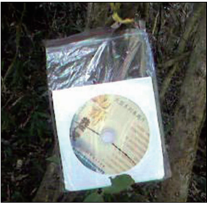
深圳景点出现九评光盘