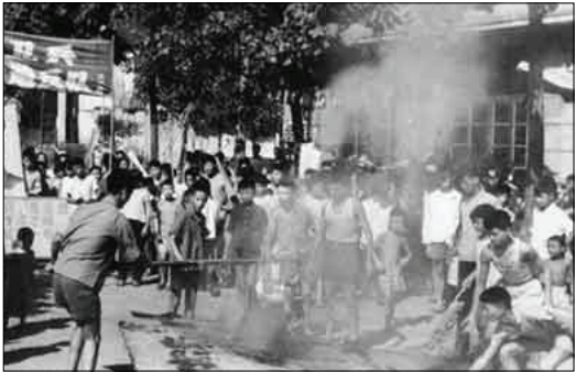
红卫兵以“革命无罪”为名四处抄家打砸抢

1966年6月北京红卫兵掀起抄家之风，迅速波及全国。全国近一千万户被抄家。之后拷打和杀戮跟进，对付以“五类分子”为主的牛鬼蛇神。