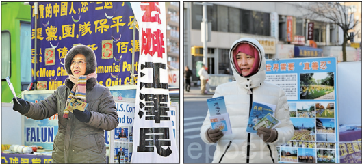
法拉盛街上的退党义工

全球退党服务中心纽约总部办公室至今成立已12年，相继在法拉盛缅街成立的五个退党点，十几年来下来已经有数十万中国人在这里“三退”。这些退党的民众说，法拉盛的退党点就像滚滚红尘中的指路明灯，让人心感安定。