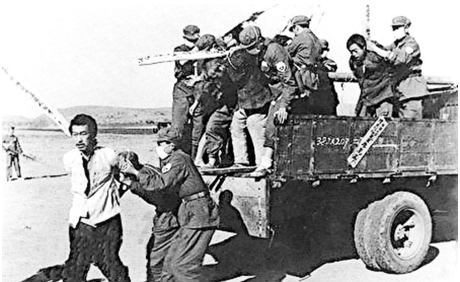
▲上世纪 50 年代中共「镇反」运动现场。

共产党的“老祖宗”马克思，早年曾经是基督徒，后来加入魔鬼撒旦教。撒旦教崇拜恶魔，与神为敌，是以破坏神的教诲、毁灭人性和人类为目的的一个邪教组织。1848年，马克思在共产党的第一份纲领文件《共产党宣言》的开篇就向世界宣布：共产主义是一个“幽灵”。这个幽灵显然就是撒旦的幽灵，是个邪灵。