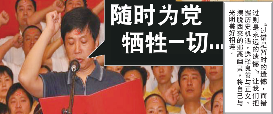
▲入中共党团队要举拳过肩发誓，说的是要随时为党牺牲性命，而且永远不背叛中共。这个誓言一出，就是一件极其可怕的事情。