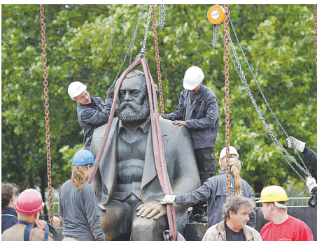
▲2010年德国柏林工作人员将马克思雕像移走。

目的不择手段”的教义均被共产党完全继承。列宁曾说：“我们必须使用所有诡计、阴谋、欺瞒、狡诈、非法手段、隐蔽手段，并掩盖真相。”