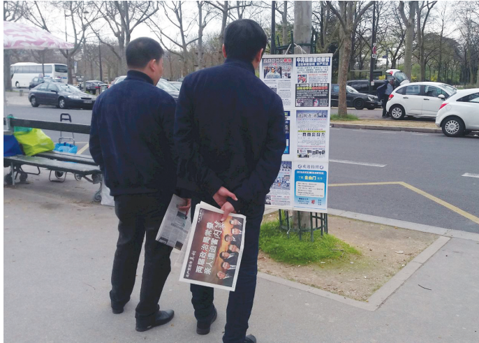
▲在巴黎埃菲尔铁塔旁的法轮功真相点上，两名大陆游客在接过《法轮功真相报》后，认真的观看揭露中共迫害法轮功的真相展板。