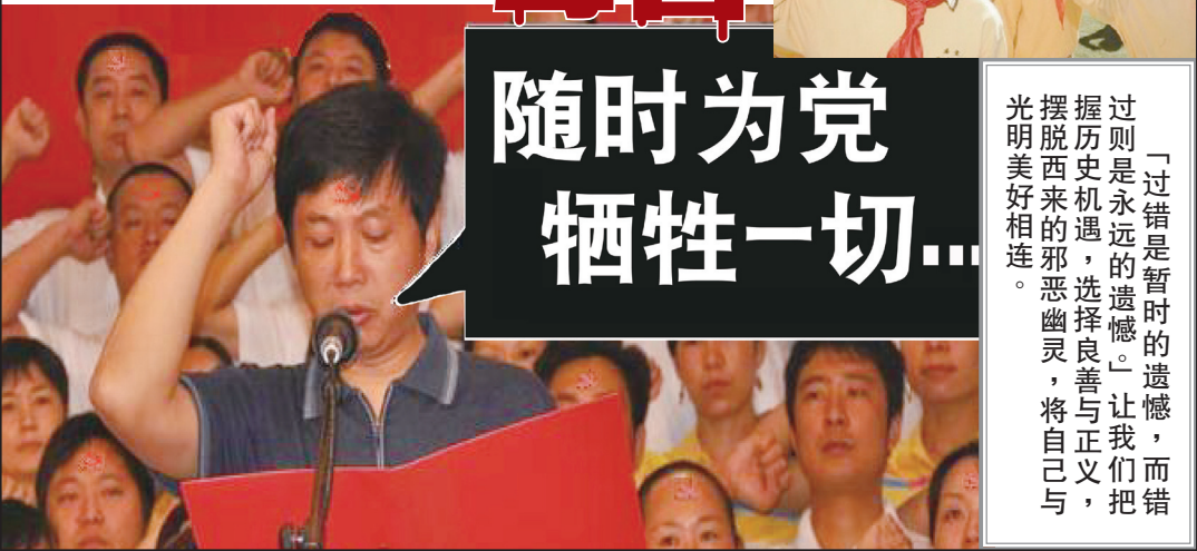
▲入中共党团队要举拳过肩发誓，说的是要随时为党牺牲性命，而且永远不背叛中共。这个誓言一出，就是一件极其可怕的事情。

思在自己的一首诗中说得十分清楚：“我年轻的双臂已充满力量，我要握住并抓碎你——人类。”因此，中共夺取政权以后，不间断地发动各种各样血腥的整人、杀人运动，使八千万无辜的中国人丧命。1999年以来，江泽民流氓集团与中共又疯狂打压信仰“真、善、忍”的法轮功修炼民众。中共是一个以斗争为