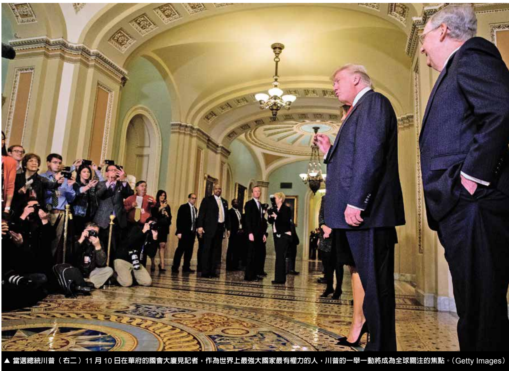
▲ 當選總統川普（右二）11月10日在華府的國會大廈見記者，作為世界上最強大國家最有權力的人，川普的一舉一動將成為全球關注的焦點。

2009年2月，美國國務卿希拉里出訪亞洲時說，「美國在人權事務上施加的壓力不能干擾在其他關鍵