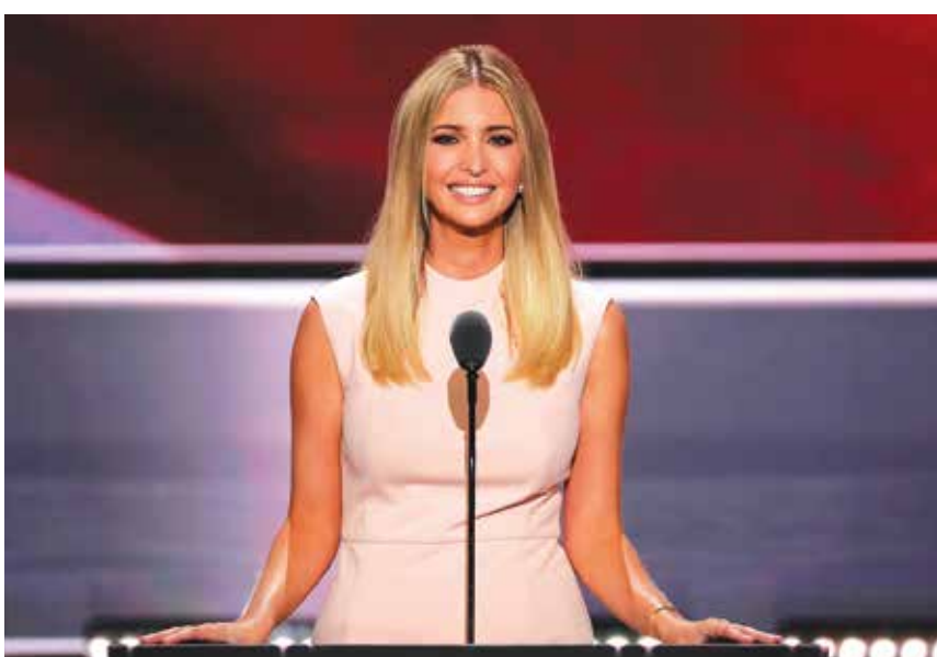
▲ 川普大女兒伊萬卡在共和黨大會上發言。

作為億萬富豪寵愛的千金，伊萬卡並沒有自大學畢業後直接進入川普集團工作，而是在紐約的一家地產公司從基層做起，同時還聯合鑽石貿易商Dynamic Diamond Corp設計與自己同名的品牌珠寶系列，