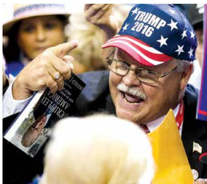
▲ 未受高等教育的白人男性是川普最鐵桿的支持群體。