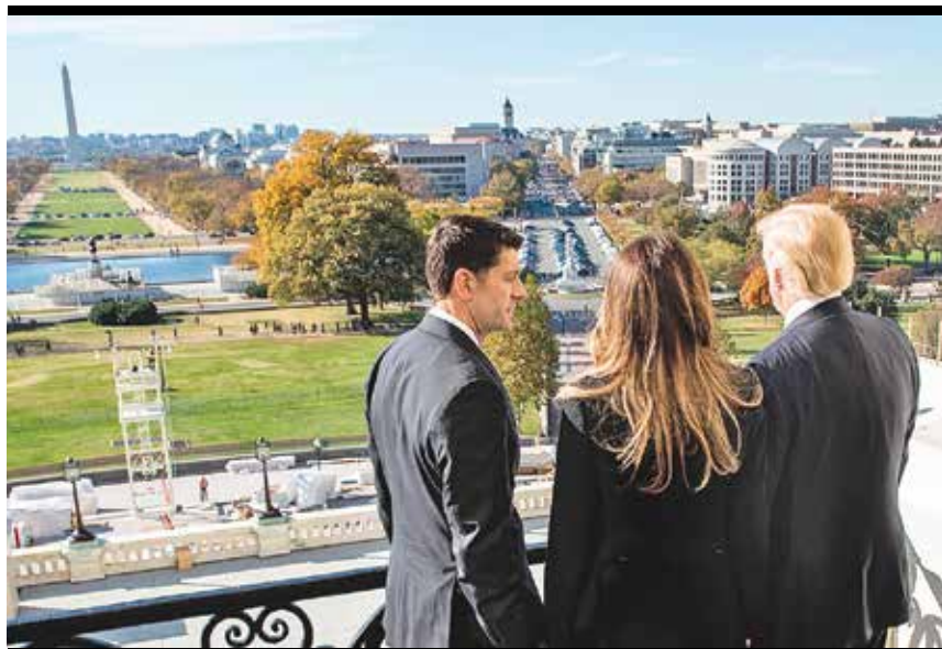
▲ 當選總統川普（右）11月10日在議院瑞安（左）的陪同下從國會山頂視他誓言要徹底改變的「華府」。

與此同時，江澤民集團迫害法輪功活摘器官的罪惡，在國際社會上被不斷曝光，美國國會和歐洲議會作出呼籲制止中共活摘器官的決議案，活摘器官罪行被世界主流媒體全面報導。習近平當局在壓力下加大了清除江澤民集團的力度，越來越多的積極參與迫害法輪功的江