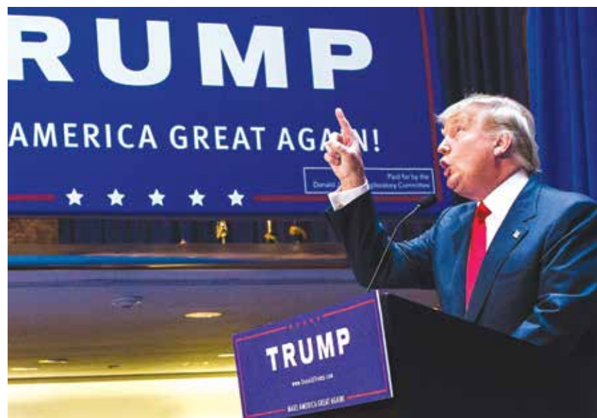
▲ 川普遠非完人，但他明顯受到上天的眷顧，背後原因何在呢？

天的青睞？很多篤信神佛存在的人也同樣感到納悶：這樣一個說話玩世不恭，爆粗口，走極端，多次破產和婚變，還涉嫌詐騙及逃稅的川普，完全不符合上帝選民的特質。或許，我們看到的是一個並不完整的川普，他也許有我們所不知曉的另一面，比如他重視親情，富有愛心和同情心，樂於幫助深陷困難之人，這樣的特質也許有助於他完成上天賦予他的使命。