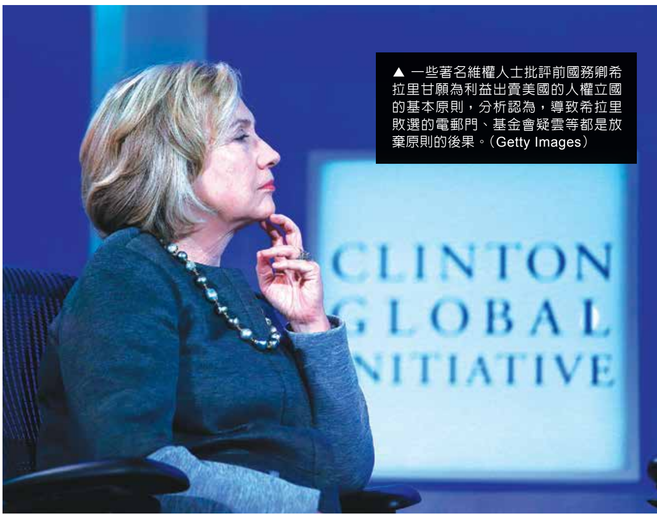
▲ 一些著名維權人士批評前國務卿希拉里甘願為利益出賣美國的人權立國的基本原則，分析認為，導致希拉里敗選的電郵門、基金會疑雲等都是放棄原則的後果。

高智晟在文中說：「2009年在秘密囚禁地，我通過秘密警察頭子嘴得以見識希拉里『為本國謀取利益』