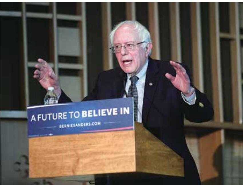
▲ 桑德斯在民主黨初選階段對希拉里構成了嚴重的威脅，和川普一樣，他激發了民主黨基層的極大熱情，但部分由於民主黨「建制派」的幕後運作，他未能在初選勝出，這導致了民主黨的分裂。

希拉里的意外失利，讓一些民主黨人開始正視該黨政策上的瑕疵，星期四，伯尼·桑德斯在接受《今日美國》採訪的時候說，他和民主黨領導人必須「從國會山走出去，進入民間，跟勞動人民接觸，並把他們的