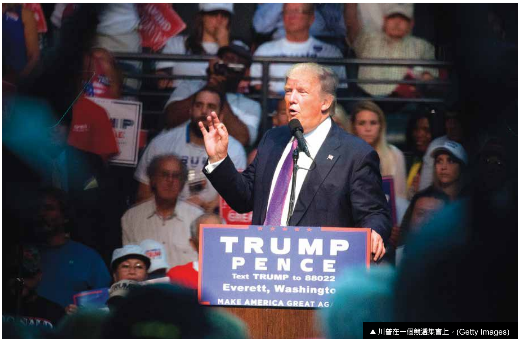
▲ 川普在一個競選集會上。(Getty Images)

這樣的「不當言論」，哪怕只發生一次，對一個普通的候選人來說，都面臨著道歉、退選，亦或慘敗的結局。而川普每次不但都生存了下來，而且以更加强硬的姿態去戰鬥。這不能不讓我們思考，川普背後是否有神秘力量的支持，或者說「冥冥之中自有天意」？