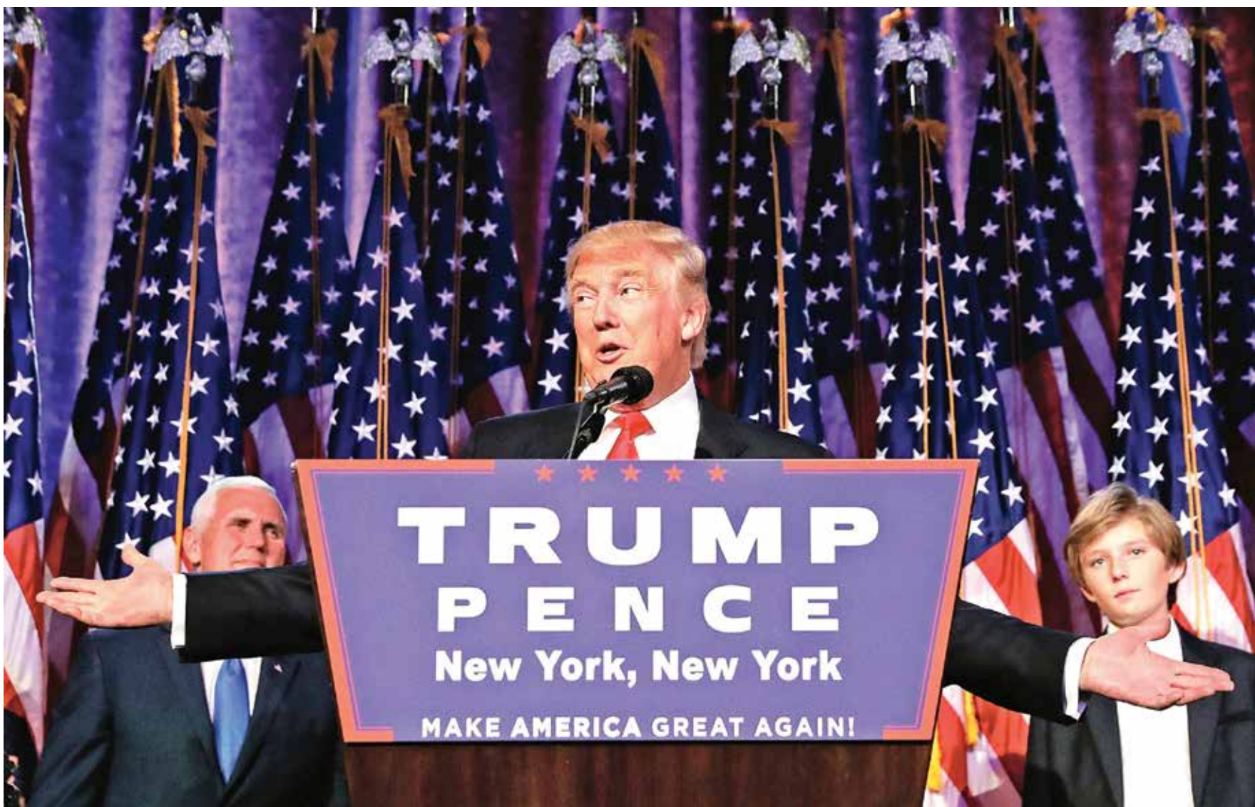
▲ 川普在美國總統大選中獲勝，即將入主白宮。

他表示，這次選舉美國社會可能出現分裂，但這分裂不一定會持續下去，如果川普的表現比較好的話，慢慢美國社會就會穩定下來。