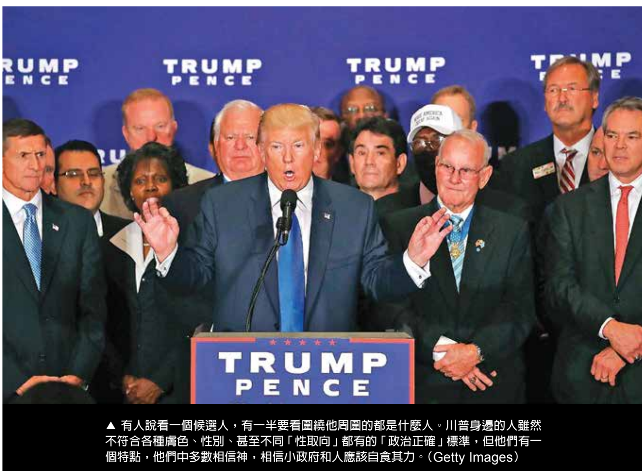
有人說看一個候選人，有一半要看圍繞他周圍的都是什麼人。川普身邊的人雖然不符合各種膚色、性別、甚至不同「性取向」都有的「政治正確」標準，但他們有一個特點，他們中多數相信神，相信小政府和人應該自食其力。

很多美國人看到了這樣的問題，所以，才有了在此次大選投票站的出口民調中，有八成的美國民眾不相信媒體。