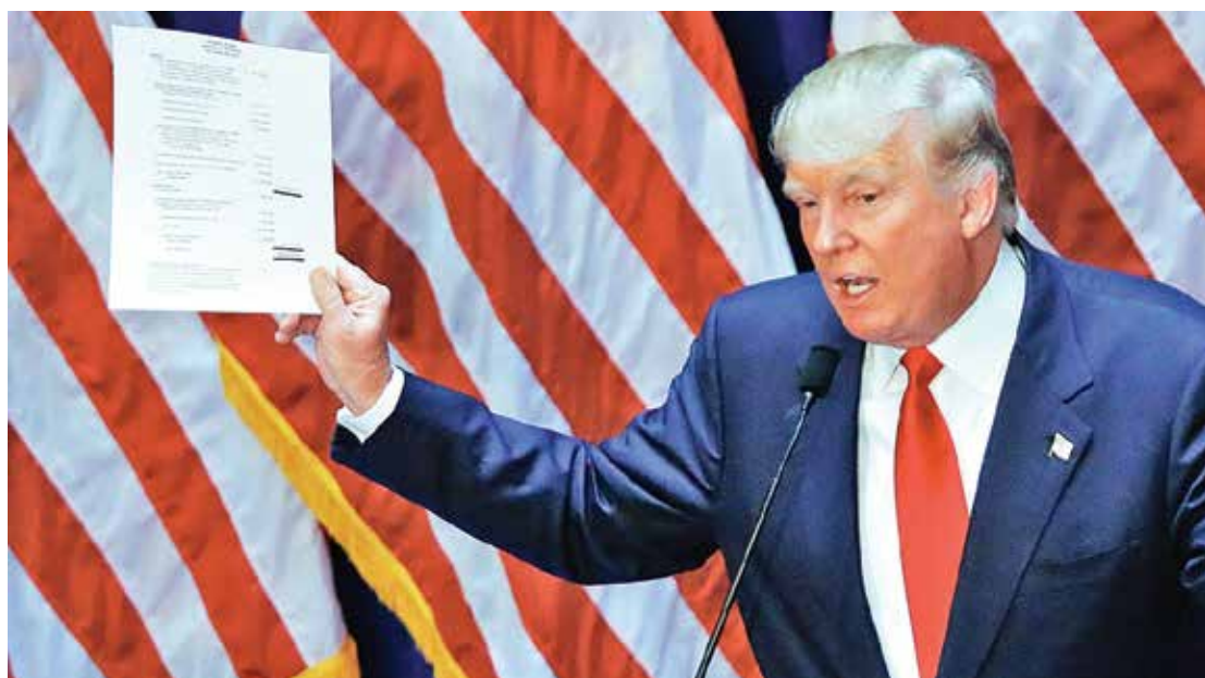
▲ 川普在去年6月16日宣布參選的演講中即誓言要在經濟上對中共更強硬。

葉科認為，川普上任後，中共會受到更大的人權壓力。他說：「川普以前是一個商業領域的人，對政治