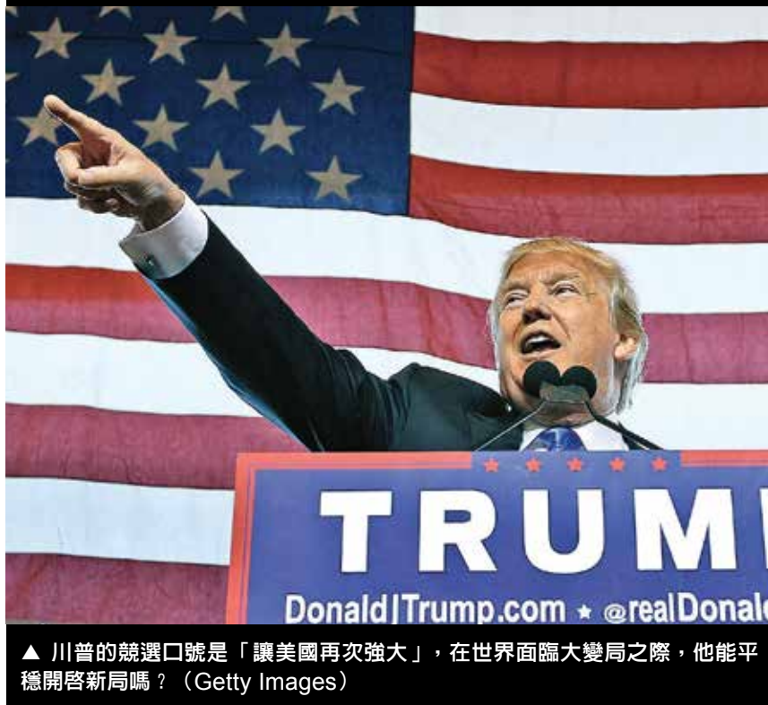
▲ 川普的競選口號是「讓美國再次強大」，在世界面臨大變局之際，他能平穩開啓新局嗎？

派官員被以貪腐罪名抓捕。這一切引起了江澤民集團的極度恐懼和瘋狂，繼續迫害法輪功以捆綁當局。