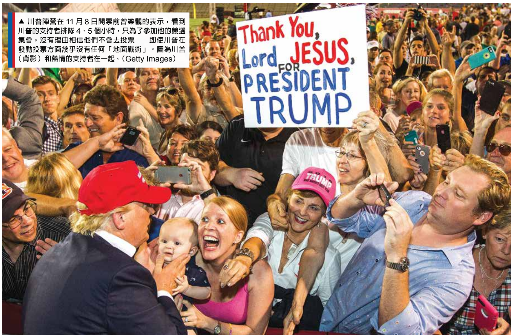
▲ 川普陣營在11月8日開票前曾樂觀的表示，看到川普的支持者排隊4、5個小時，只為了參加他的競選集會，沒有理由相信他們不會去投票——即使川普在發動投票方面幾乎沒有任何「地面戰術」。圖為川普(背影)和熱情的支持者在一起。

但與民調不同的是川普在網絡上的人氣，川普的推特持有1,300萬追蹤者、臉書有1,210萬粉絲，很多支