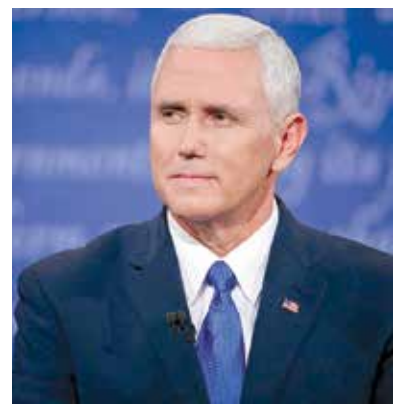
▲ 彭斯表示：「我首先是一個基督徒，然後是保守派和共和黨人。」

此外，川普勝選當晚，希拉里最親近幕僚阿伯丁（Huma Abedin）在半夜致電康威，請她讓川普接電話，讓希拉里向川普承認敗選。◇